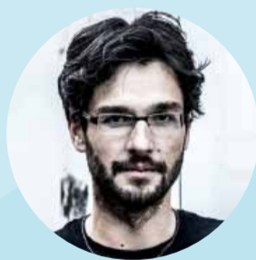
Robert Seeger Agentur für Kommunikationskunst