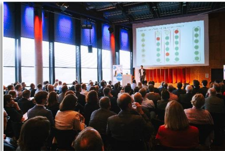
Kunden- und Expertenvorträge